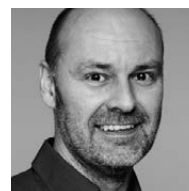
René Walker Energie